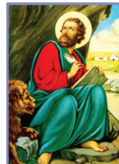
25 വി. മർക്കോസ്