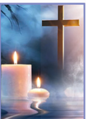
16 വലിയ ശനി