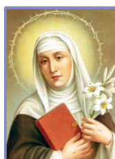
29 സിയന്നായിലെ വി. കാതറിൻ