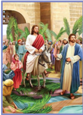
10 ഓരാന ഞായർ