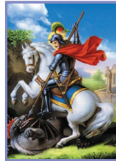
24 വി. ഗീവർഗീസ്