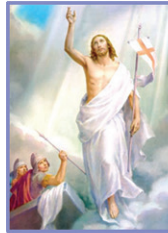
17 ഉയിർപ്പു തിരുനാൾ